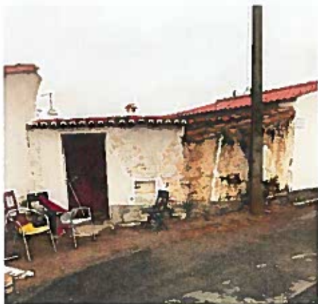
Fig. 1 – Fachada;