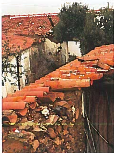
Fig. 3 – Cobertura;