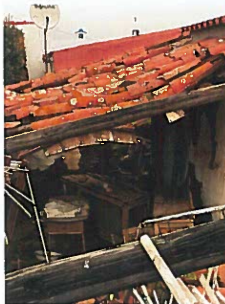
Fig. 2 – Cobertura;